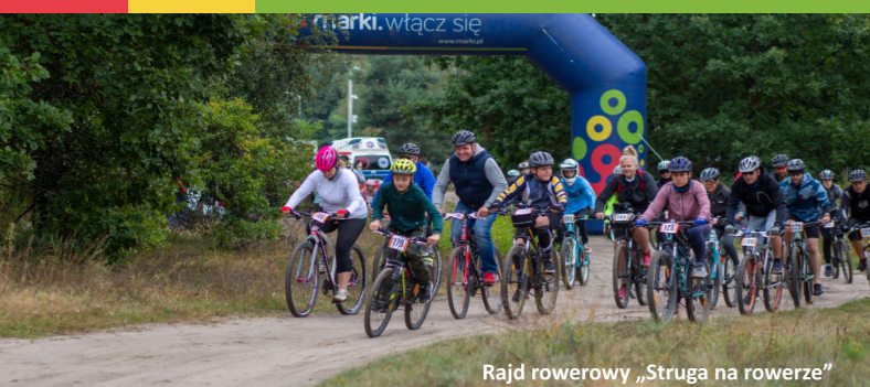
Rajd rowerowy „Struga na rowerze”