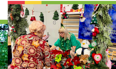
Marecki Jarmark Świąteczny