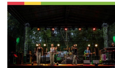
„Zakończenie Lata” w parku miejskim