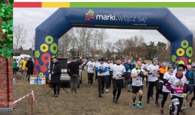
X edycja Biegu Tropem Wilczym