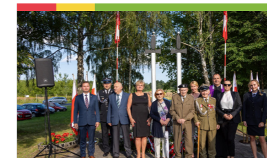
78. rocznica wybuchu Powstania Warszawskiego