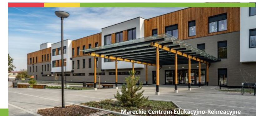
Mareckie Centrum Edukacyjno-Rekreacyjne

Tyle kosztów edukacji pokryła subwencja oświatowa od państwa. Większość wydatków na ten cel poniosło nasze miasto.