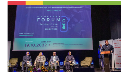
I Mareckie Forum Bezpieczeństwa Ruchu Drogowego